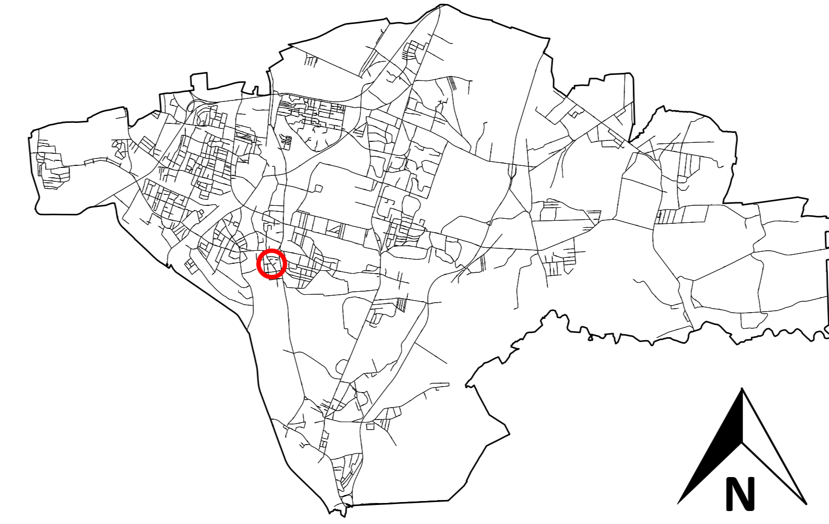
ORIENTACJA TERENU W SKALI MIASTA

ZAŁĄCZNIK NR 1 DO UCHWAŁY NR RADY MIEJSKIEJ W SOSNOWCU Z DNIA