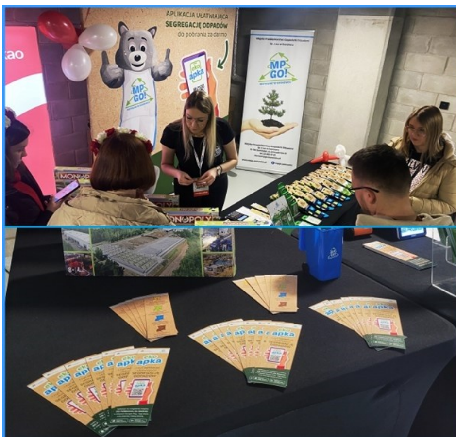
Przykład stoiska promocyjnego „Ekoapki” podczas rozgrywek sportowych na terenie Zagłębiowskiego Parku Sportowego